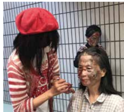
映画「門真市ゾンビ人材センター」の撮影風景

「門真市ゾンビ人材センター」と聞いて、わくわくしませんでしょうか。そのわくわくする気持ちを何より大切にしております。