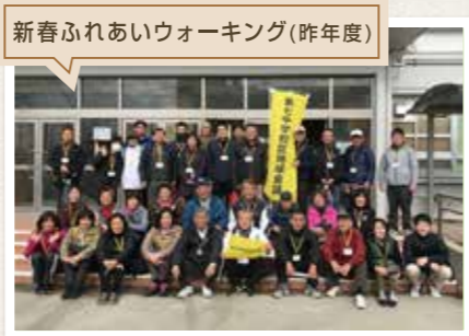
新春ふれあいウォーキング(昨年度)