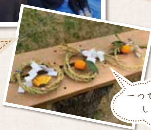
一つひとつ素心の違うしめ縄が完成!