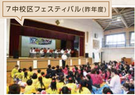
7中校区フェスティバル(昨年度)

「第七中学校区地域会議」は二島小学校と五月田小学校、2つの小学校区がひとつとなり、安心安全で魅力のある地域づくりを行っていくために設立されました。令和の始まりとともに始まった活動は、人や地域への想いが原動力となっています。今年は新型コロナウイルスの影響で思うような事業ができずにはいますが、こんなときだからこそ、地域住民がつながること、思い合うことの大切さを再認識し、コロナに分断されないための発信(活動)ができればと思っています。今は間接的ですが、コロナが収束した時には全力で! リアルにつながります!! 皆さま方のご協力、よろしくお願いします。