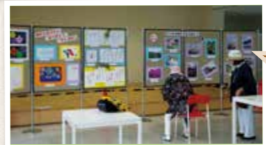
あなたの作品大募集!(今年度)

市民公益活動支援センターは、「非営利」かつ「不特定多数の利益」となる、市民公益活動をサポートしています。