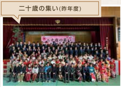
二十歳の集い(昨年度)