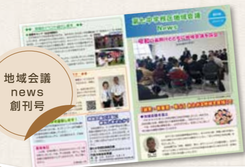
地域会議 news 創刊号