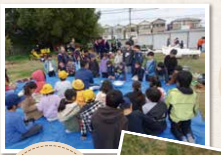
しめ縄クリスマスリース作り(昨年度)