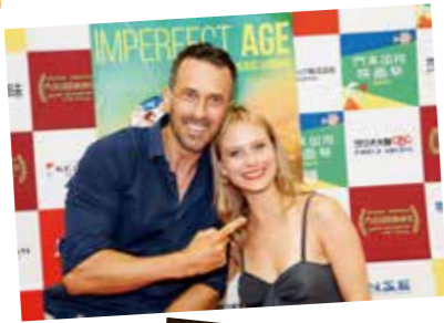
(写真上) 門真国際映画祭の受賞者 (写真右) 撮影した東大寺大仏殿

また地域イベントなどの撮影も行っており、直近では世界遺産でもある東大寺の大仏殿で開催されました新型コロナウイルス終息祈願法要と奉納演奏の撮影をさせていただきました。大仏様のお膝元での撮影は感無量でした。